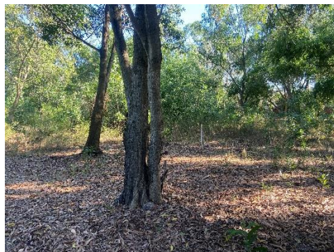
Figura 6 - Vegetação existente.