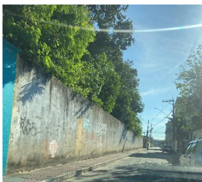
Figura 9 - Vista externa do muro.