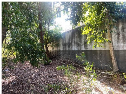
Figura 5 - Vegetação existente.