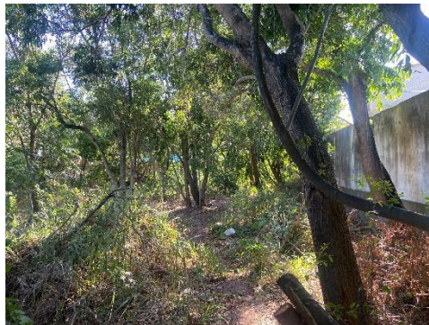
Figura 2 - Vegetação existente.