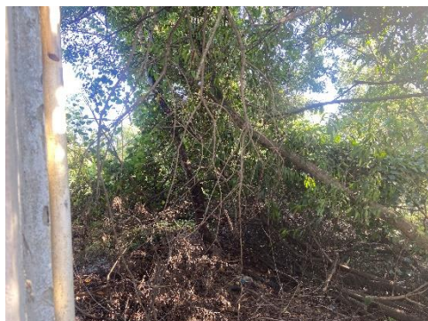
Figura 1 - Vegetação existente.