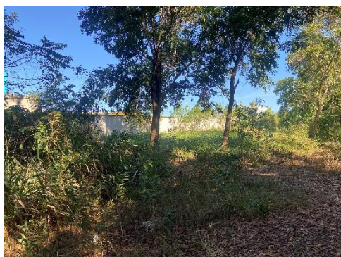
Figura 7 - Vegetação existente.