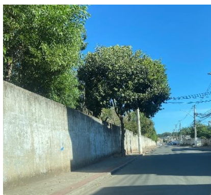
Figura 10 - Vista externa do muro.