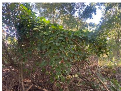
Figura 4 - Vegetação existente.