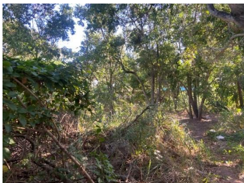
Figura 3 - Vegetação existente.