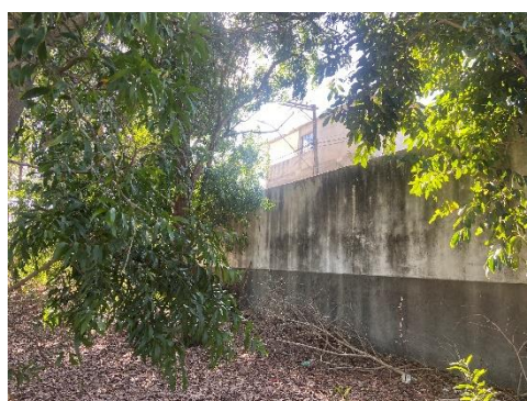
Figura 8 - Vegetação existente.